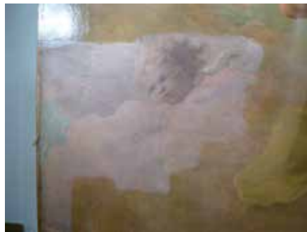
De plafondschildering van Pellegrini krijgt een opknappbeurt